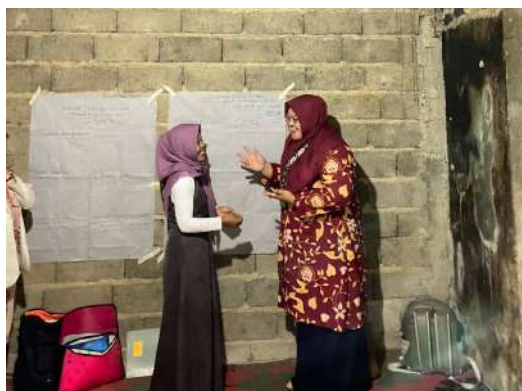
Gambar 2. Pelaksanaan Demonstrasi Komunikasi Terapeutik

Peserta kemudian dibagi menjadi 6 kelompok untuk melakukan diskusi dan demonstrasi terkait komunikasi pada tahapan 5 meja posyandu balita. Setelah itu kelompok menyusun komunikasi yang akan diberikan pada balita, ibu hamil dan ibu menyusui. Selanjutnya, masing-masing kelompok menentukan peran sebagai masyarakat yang mempunyai balita, ibu hamil, dan ibu nifas dan menjadi kader penyuluh. Setiap kelompok diberikan kasus yang sama untuk dilakukan demonstrasi bentuk komunikasi verbal dan non verbal. Kemudian tiap kelompok akan memberikan tanggapan pesan yang disampaikan jelas dan bahasa yang digunakan mudah dipahami oleh masyarakat.