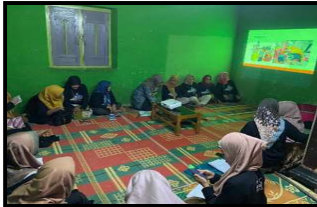
Gambar 1. Pelaksanaan Pendidikan Kesehatan

pada anak, bentuk-bentuk komunikasi pada bayi dan anak, teknik-teknik komunikasi pada anak, penerapan komunikasi sesuai tingkat perkembangan anak, faktor-faktor yang mempengaruhi komunikasi, dan penghambat komunikasi. Narasumber juga menampilkan presentasi, tanya jawab dan video komunikasi yang tidak efektif.