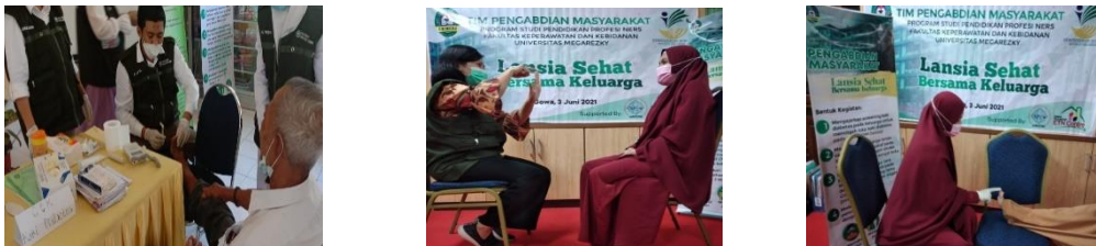
Gambar 1.2.3 : Dokumentasi Kegiatan