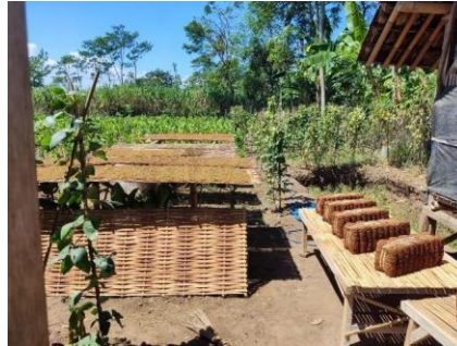
gambar 1. Potensi Tembaku desa Mojo 15

yang diusung oleh kelompok kkn 448 meliputi: penyuluhan hama dan penyakit tanaman tembakau, membuat e-book, dan membuat asosiasi petani tembakau sebagai upaya awal meningkatkan produktivitas tembakau Mojo.