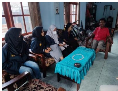
gambar 2. Wawancara bersama petani tembakau untukmenggali permasalahan

Primadona tanaman unggulan di Desa Mojo adalah Tembakau atau dikenal sebagai tembakau Mojo, eksistensi tembakau mojo sudah dikenal hingga masyarakat di luar Desa Mojo. Rasa tembakau Mojo yang khas membuat kebutuhan pasar tembakau Mojo cepat tinggi, banyak konsumen yang berdatangan ke rumah petani-petani tembakau Mojo untuk mencari tembakau Mojo. Akan tetapi tingginya minat konsumen berbanding terbalik dengan ketersediaan tembakau Mojo, hal ini dikarenakan banyak lahan petani yang terserang hama dan penyakit tanaman. Para petani terjadi penurunan produksi hingga gagal panen diakibatkan serangan hama dan penyakit tanaman tembakau.