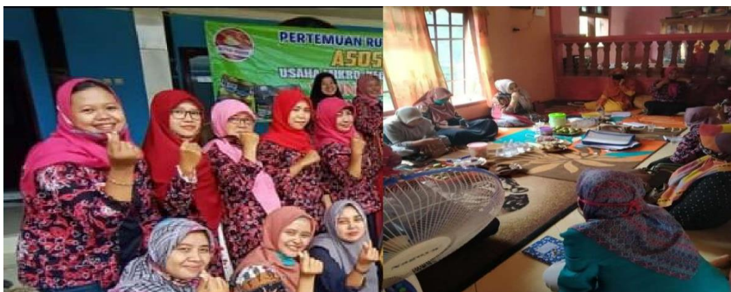
Gambar 5. Proses Pelatihan Penguatan Pengemasan Produk Batik

Hasil penguatan usaha yang dilakukan tim pengabdian terhadap pengrajin batik Banyuwangi, dengan penguatan usaha dengan melakukan pendampingan dan mencari mitra yaitu galery-galery batik yang ada di kota Banyuwangi. Sehingga dengan adanya mitra dapat meningkatkan penjualan produk kerajinan tangan batik yang dihasilkan, dan dapat memperluas pemasaran produk batik Banyuwangi Kecamatan Rogojampi Kabupaten Banyuwangi. Galery-Galery di tempat wisata dan kawasan Kota Banyuwangi akan mempermudah pengunjung dan konsumen untuk membeli hasil produksi pengrajin batik, misalnya toko oleh-oleh khas Banyuwangi. Pendampingan dan pelatihan dilakukan dua kali tatap muka dengan tiga sampai empat jam untuk setiap tatap muka. Berikut gambar proses diskusi dan pendampingan dalam upaya bermitra dengan pemilik gallery di Kota Banyuwangi.