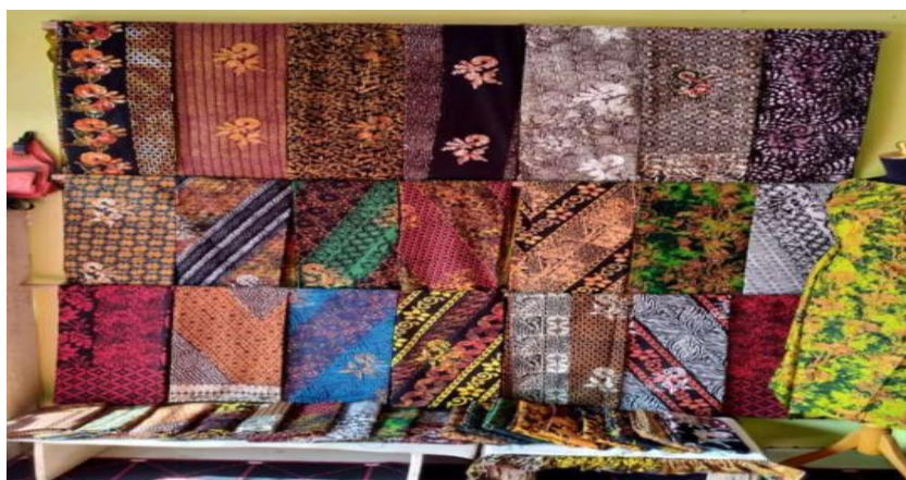
Gambar 1. Bahan Batik Yang dihasilkan pengrajin batik Kecamatan Rogojampi Kabupaten Banyuwangi

Berdasarkan uraian diatas dengan analisa situasi dan permasalahan atas kondisi yang dihadapi pengrajin Batik Banyuwangi, dapat digambarkan bahwa kerajinan tangan berbahan baku batik lokal Banyuwangi memerlukan pendampingan pada lembaga pendidikan dan dinas terkait untuk mengatasi solusi dalam upaya meningkatkan pendapatan pengrajin Batik Kecamatan Rogojampi Kabupaten Banyuwangi. Berikut beberapa motif batik yang dihasilkan masyarakat(pengrajin) Batik banyuwangi di Kecamatan Rogojampi Kabupaten Banyuwangi.