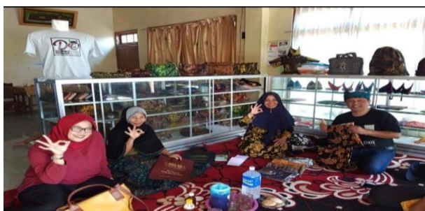
Gambar 4. Hasil Proses Pelatihan Diversifikasi Produk dan display

Hasil penguatan usaha yang dilakukan tim pengabdian terhadap pengrajin batik Banyuwangi, dengan penguatan usaha dengan melakukan pendampingan dan mencari mitra yaitu galery-galery batik yang ada di kota Banyuwangi. Sehingga dengan adanya mitra dapat meningkatkan penjualan produk kerajinan tangan batik yang dihasilkan, dan dapat memperluas pemasaran produk batik Banyuwangi Kecamatan Rogojampi Kabupaten Banyuwangi. Galery-Galery di tempat wisata dan kawasan Kota Banyuwangi akan mempermudah pengunjung dan konsumen untuk membeli hasil produksi pengrajin batik, misalnya toko oleh-oleh khas Banyuwangi. Pendampingan dan pelatihan dilakukan dua kali tatap muka dengan tiga sampai empat jam untuk setiap tatap muka. Berikut gambar proses diskusi dan pendampingan dalam upaya bermitra dengan pemilik gallery di Kota Banyuwangi.