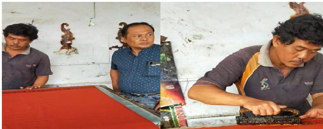
Gambar 3. Proses Percobaan alat stempel dengan modifikasi baru

Berdasarkan upaya yang dilakukan dalam tahap pertama, yaitu dengan meningkatkan produksi dengan mempernyak motif cap dan cap yang dimiliki pengrajin batik maka produksi yang dihasilkan pengrajin mengalami peningkatan dari sebelumnya. Hal ini dikarenakan, batik yang dihasilkan tidak hanya batik tulis namun juga batik cap dengan berbagai motif. Berikut gambar proses uji coba cap dengan motif baru yang dihasilkan hasil diskusi pengrajin dengan tim pengabdian masyarakat.