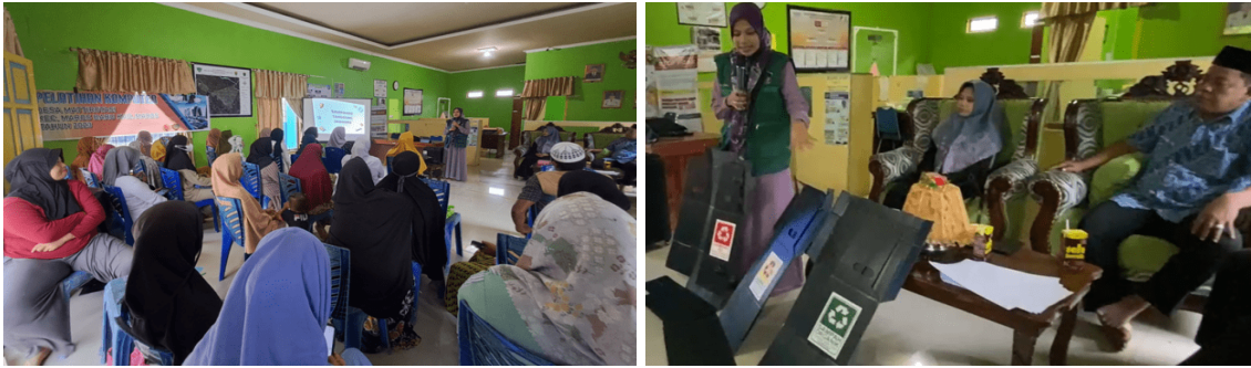
Gambar 1 & 2 : Penyuluhan dan Pelatihan pendampingan pemilahan sampah dalam mengurangi resiko terjadinya bencana